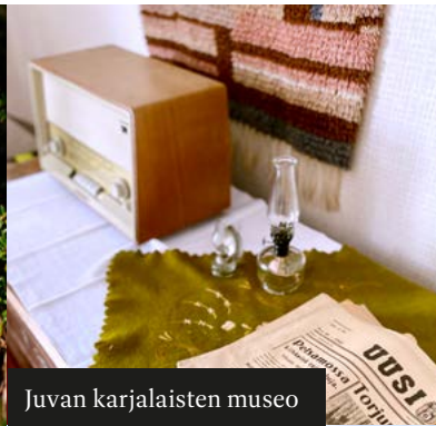
Juvan karjalaisten museo