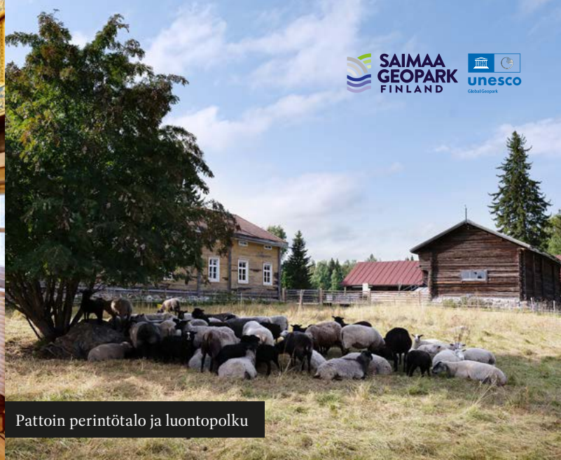
Pattoin perintötaalo ja luontopolku